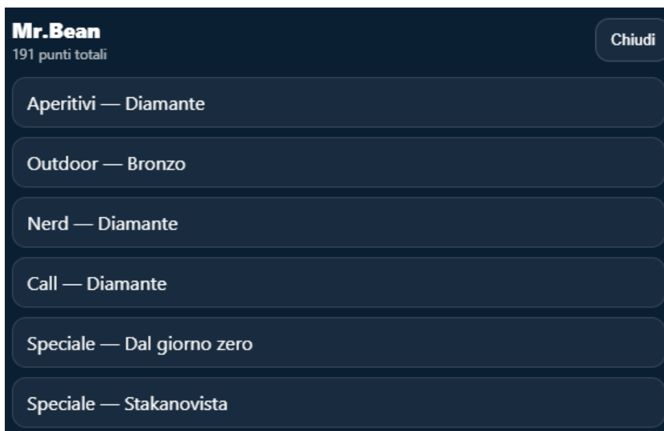
Figura 3: Esempio di finestra di dettaglio con gli achievement ottenuti da un giocatore

La finestra di dettaglio consente di visualizzare gli achievement sbloccati nelle varie categorie, ad esempio Aperitivi, Outdoor, Nerd, Call e gli eventuali badge speciali.